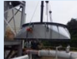
焼却炉の復旧作業の様子