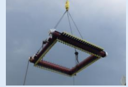
ボイラの管寄せ部