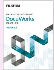
使用しているソフトウェア