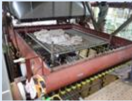
焼却炉とボイラ上部の接合部