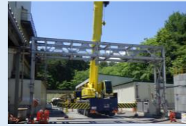
120t 大型ラフタークレーン