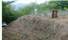
田代、山根、宇堂口、戸田、瀬月内、山屋の水道施設、九戸村の浄水場など。