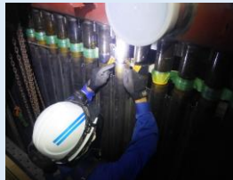
ボイラ溶接士の免許を持った職人による溶接作業の様子