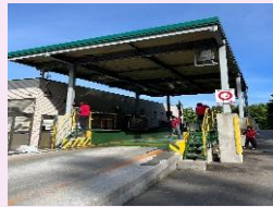
管理 1 課 細川 希

環境整備活動として月 2 回、トラックスケール（計量器）の清掃を行います。気持ちよく来場していただけるよう汚れを洗い流します。