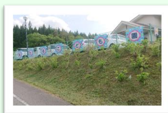
ひめほたるこども園